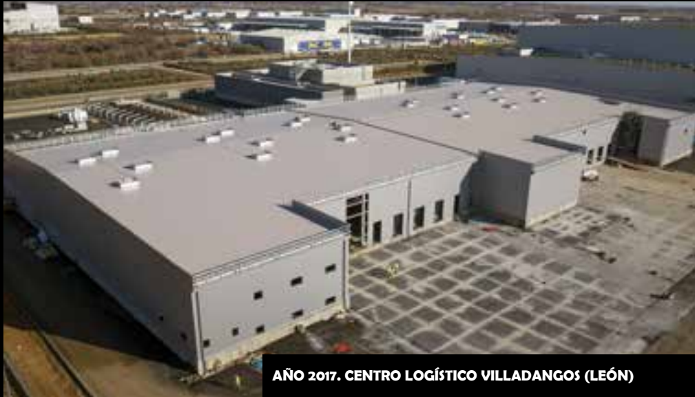
AÑO 2017. CENTRO LOGÍSTICO VILLADANGOS (LEÓN)

-9.000 m2 de cubierta deck acabada con lámina TPO de 1,8mm. -5.000 m2 de cerramiento de fachada de panel sándwich.