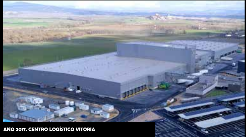
AÑO 2017. CENTRO LOGÍSTICO VITORIA

-9.000 m2 de cubierta deck acabada con lámina TPO de 1,8mm. -5.000 m2 de cerramiento de fachada de panel sándwich.