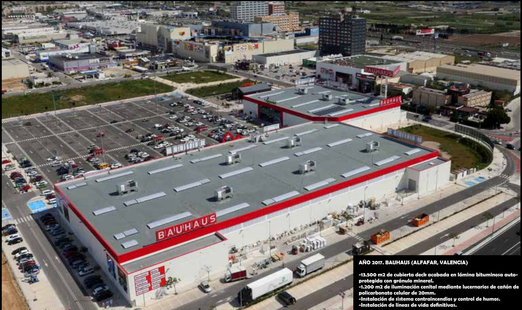
AÑO 2017. BAUHAUS (ALFAPAR, VALENCIA)