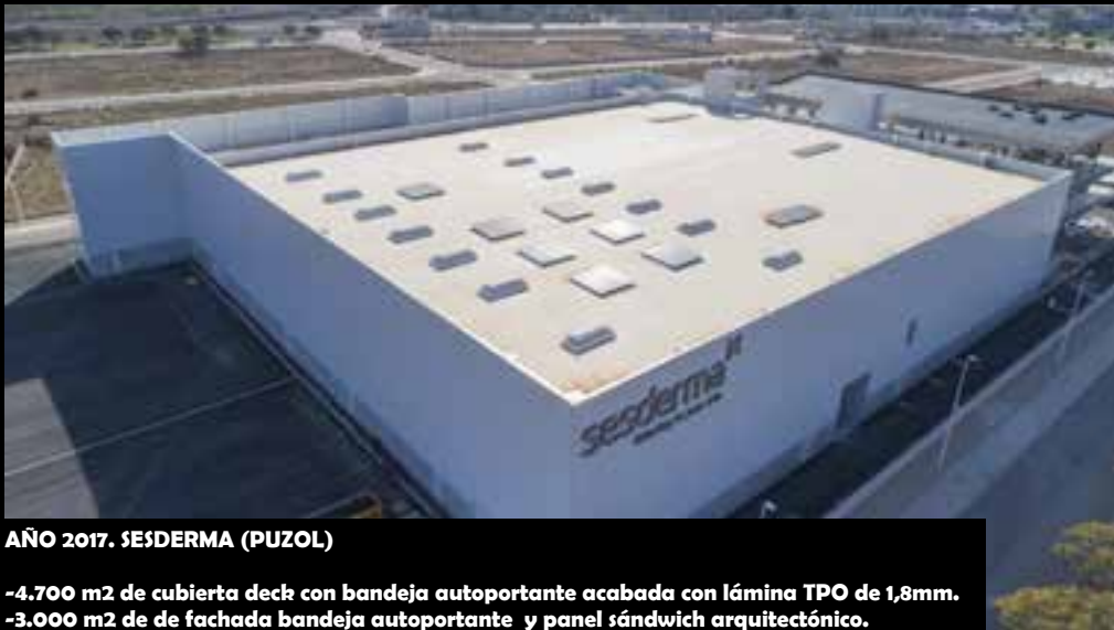
AÑO 2017. SESDERMA (PUZOL)

-4.700 m2 de cubierta deck con bandeja autoportante acabada con lámina TPO de 1,8mm. -3.000 m2 de fachada bandeja autoportante y panel sándwich arquitectónico.