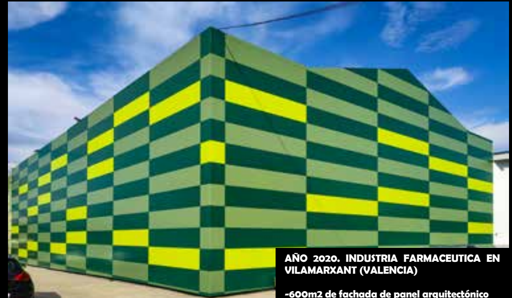
AÑO 2020. INDUSTRIA FARMACEUTICA EN VILAMARXANT (VALENCIA)

-600m2 de fachada de panel arquitectónico