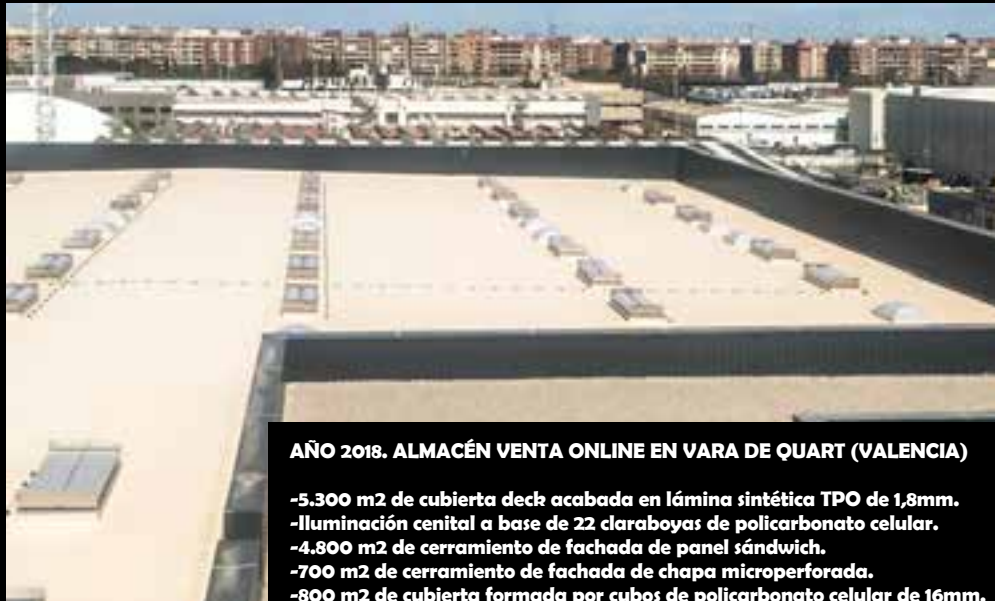
AÑO 2018. ALMACÉN VENTA ONLINE EN VARA DE QUART (VALENCIA)