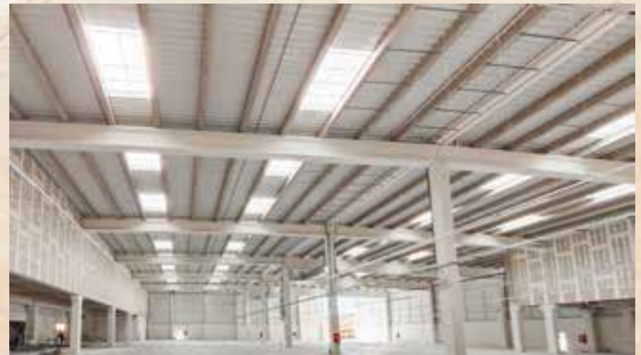
AÑO 2022. LOGÍSTICO AMAZON EN ESCÚZAR (GRANADA) -8.000 m2 de cubierta deca acabada en lámina sintética TPO de 1,5mm. -Iluminación cenital a base de 55 claraboyas de policarbonato celular.