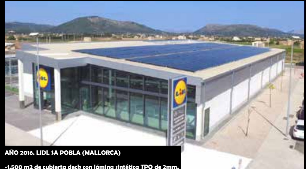
AÑO 2016. LIDL SA POBLA (MALLORCA)

-4.700 m2 de cubierta deck con bandeja autoportante acabada con lámina TPO de 1,8mm. -3.000 m2 de fachada bandeja autoportante y panel sándwich arquitectónico.